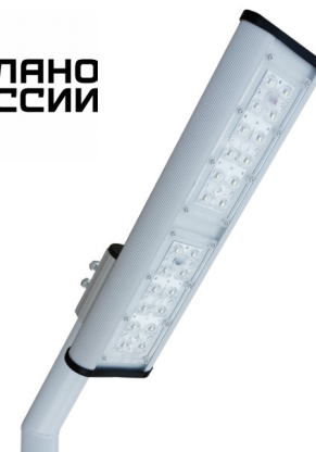
Рис. 1. Светильник «Модуль Магистраль» консоль, КМО-1, 56Вт, IP67