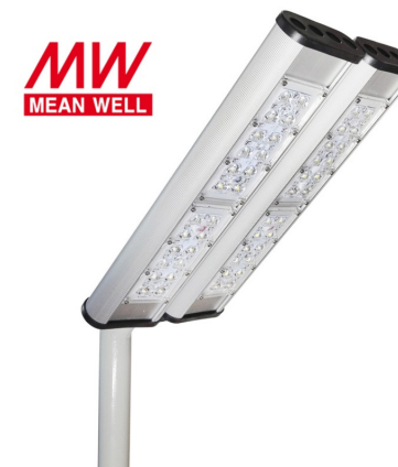
Рис. 1. Светильник «Модуль Магистраль» консоль КМО-2, IP67.

1.3 Производитель оставляет за собой право вносить в конструкцию и комплектацию изделия технические изменения и усовершенствования, не ухудшающие технические характеристики изделия, в любое время и без предварительного уведомления.