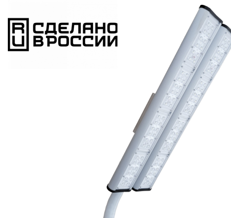
Рис. 1. Светильник «Модуль Магистраль» консоль КМО-2, IP67.

1.3 Производитель оставляет за собой право вносить в конструкцию и комплектацию изделия технические изменения и усовершенствования, не ухудшающие технические характеристики изделия, в любое время и без предварительного уведомления.