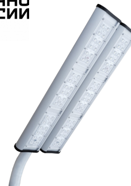
Рис. 1. Светильник «Модуль Магистраль» консоль КМО-2, IP67.