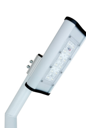
Рис. 1. Светильник «Модуль Магистраль» консоль, КМО-1, 26Вт, IP67

1.3 Производитель оставляет за собой право вносить в конструкцию и комплектацию изделия технические изменения и усовершенствования, не ухудшающие технические характеристики изделия, в любое время и без предварительного уведомления.